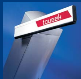
závorové systémy tousek robustní a tvarově dokonalé