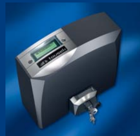
pohony posuvných bran tousek kompaktní a stabilní