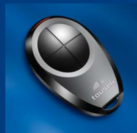
program dálkového ovládání tousek kompatibilní a bezpečný