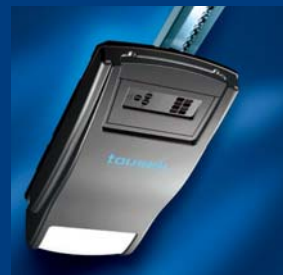
pohony garážových vrat tousek úsporné a rychlé